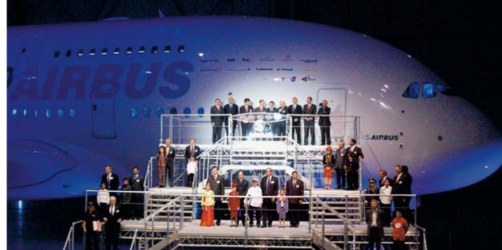
Die Staatschefs der Partnerländer – Tony Blair, Jacques Chirac, Gerhard Schröder und José Luis Rodríguez Zapatero gemeinsam mit den Airbus-Shareholdern, Airline-Repräsentanten und Airbus-Chef Noël Forgeard

Repräsentanten der 14 A380-Erstkunden erläuterten auf der Projektionsfläche ihre Gründe für die Bestellung dieses größten Verkehrsflugzeugs, und wie ihre Fluggäste davon profitieren werden: „Ein solches Flugzeug wird zur Trumpfkarte für jede Fluggesellschaft,“ war etwa Jean-Cyril Spinetta, Chef