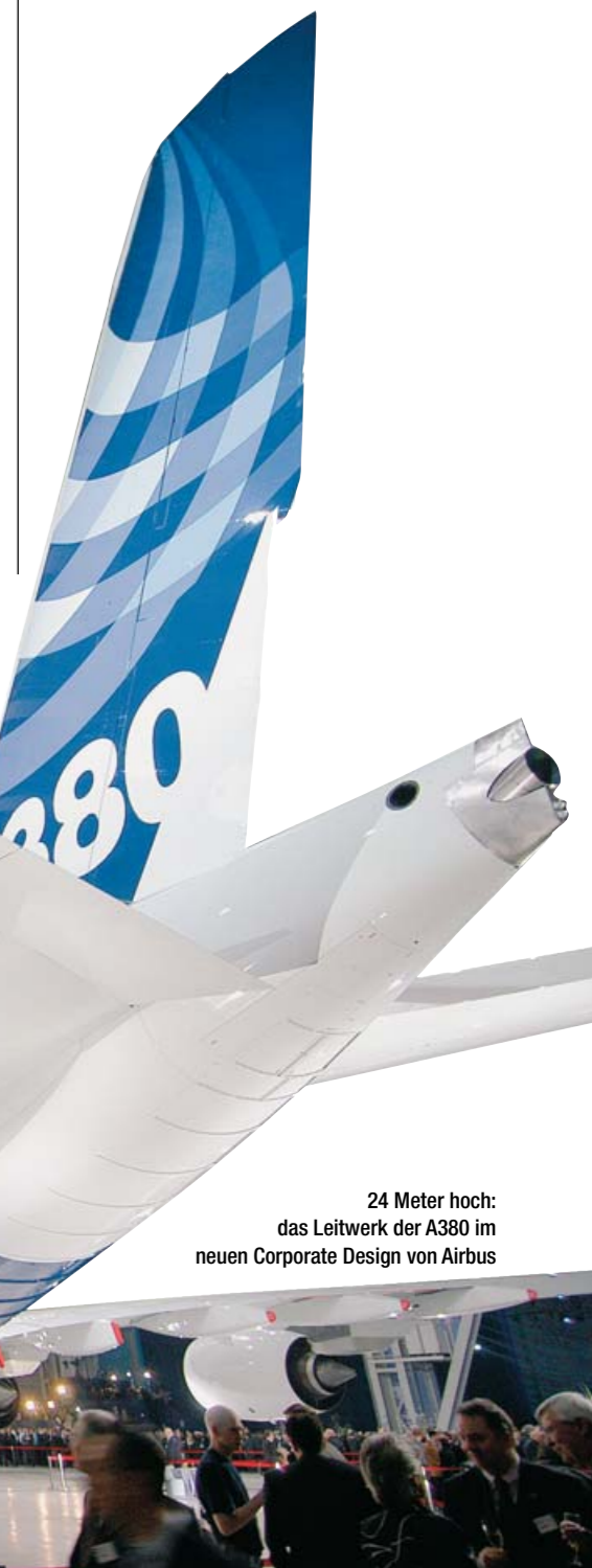
24 Meter hoch: das Leitwerk der A380 im neuen Corporate Design von Airbus

Weitere Informationen zum Reveal der A380 unter: http://www.airbus.com